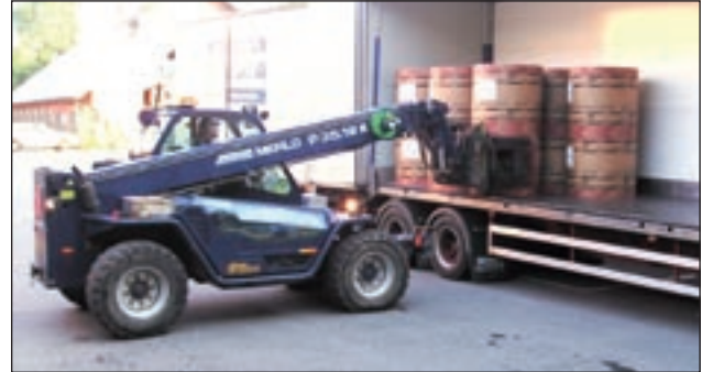
Hantering av tidningspappersrullar hos Alingsås Tidning, inga problem!

– Man rycker in där det behövs och uppdragen kan handla om allt från tio minuters körning till större uppdrag som tar betydligt längre tid. Det mesta handlar faktiskt om