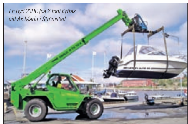
En Ryd 23DC (ca 2 ton) flyttas vid Ax Marin i Strömstad.

De sex anställda vid AX Marin använder ett hemmade-signat lyftok (eller vid lastning och lossning, gafflar) när båtarna lyfts och flyttas.