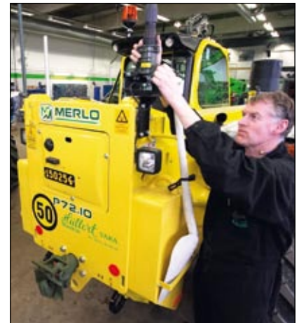
Varje Merlomaskin har fått sin leveransservice utförd vid Hüllerts verkstad i Vara och levereras till försvaret med bland annat personkorg, radiostyrning, skopor och pallgafflar.

Sverige leder NBG, som har sin beredskapsperiod fram till den 30 juni i år. Därefter kommer Merlo-resurserna att ingå i den ordinarie svenska insatsberedskapen.