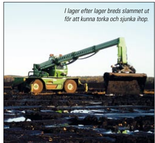
I lager efter lager bredds slammet ut för att kunna torka och sjunka ihop.

Tack vare slamhanteringen kan Rönneholms mosse användas för slamdeponin på ett miljövänligt sätt, som till sist återställer mossen.