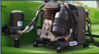
Ett VBG-drag har monterats bak på maskinen, som också försetts med luftkompressor för att manövrera draget och förse de kopplade släpen med tryckluft.