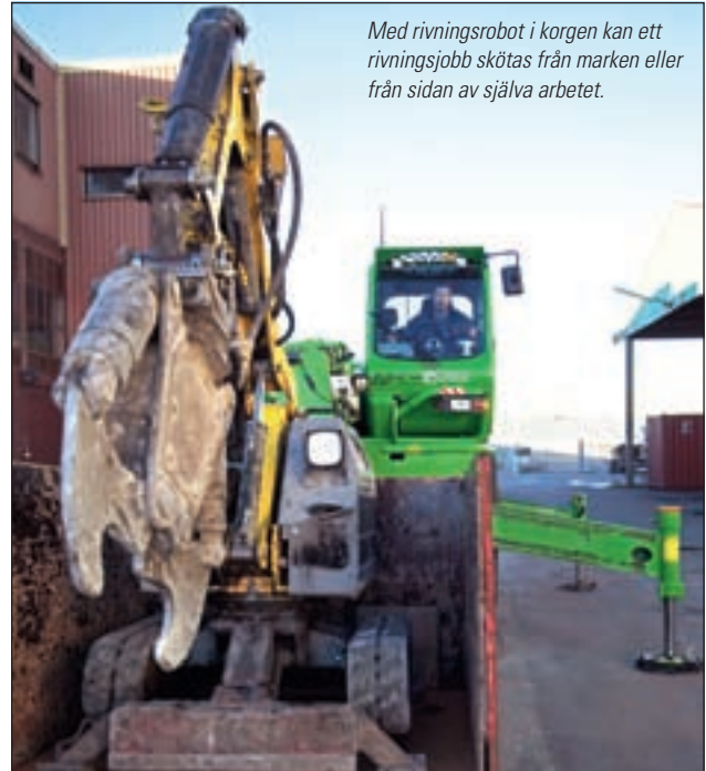
Med rivningsrobot i korgen kan ett rivningsjobb skötas från marken eller från sidan av själva arbetet.